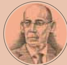
אמיר ירון, נגיד בנק ישראל